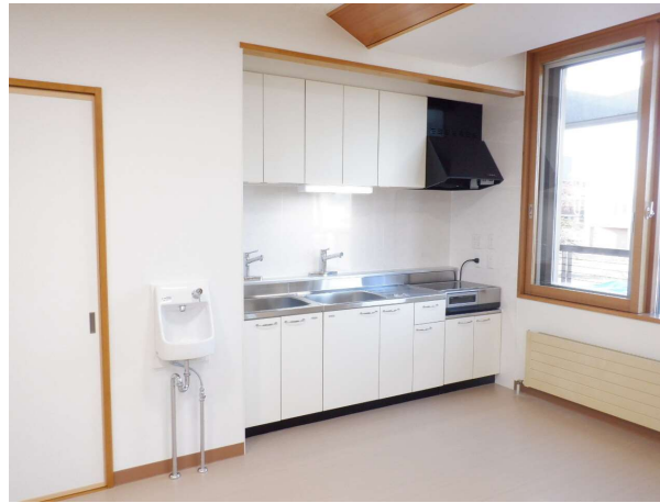
ふれあいルーム (保健福祉センター 2階)