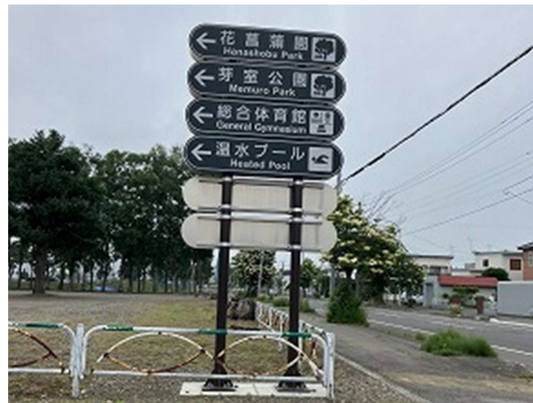
誘導サイン・案内サイン