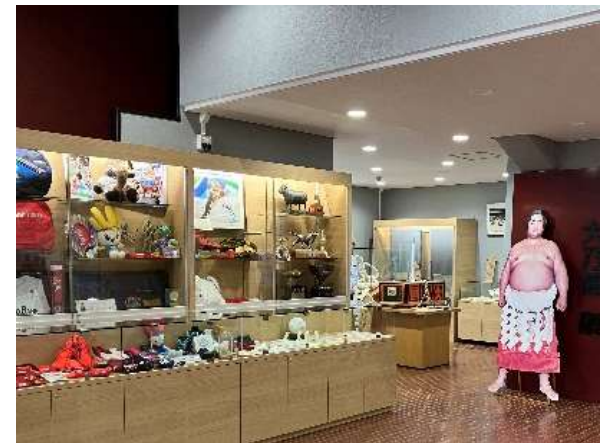
アスリートミュージアム (総合体育館内)