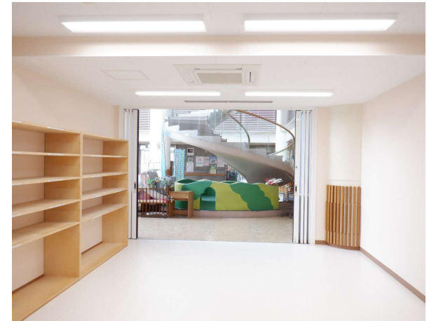
育児ネットめむろ (保健福祉センター 1階)