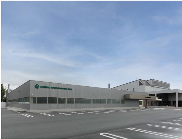
温水プール [トレーニングセンター含む]