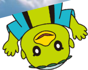
揖斐川町マスコットキャラクター かっぱの河太郎