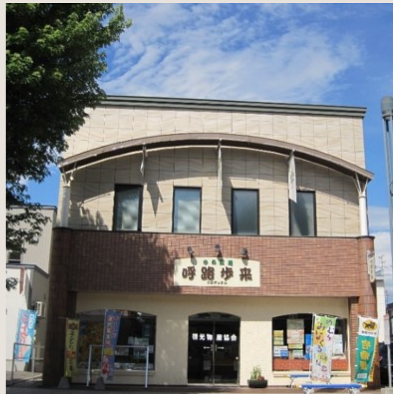
観光物産協会 (呼路歩来)