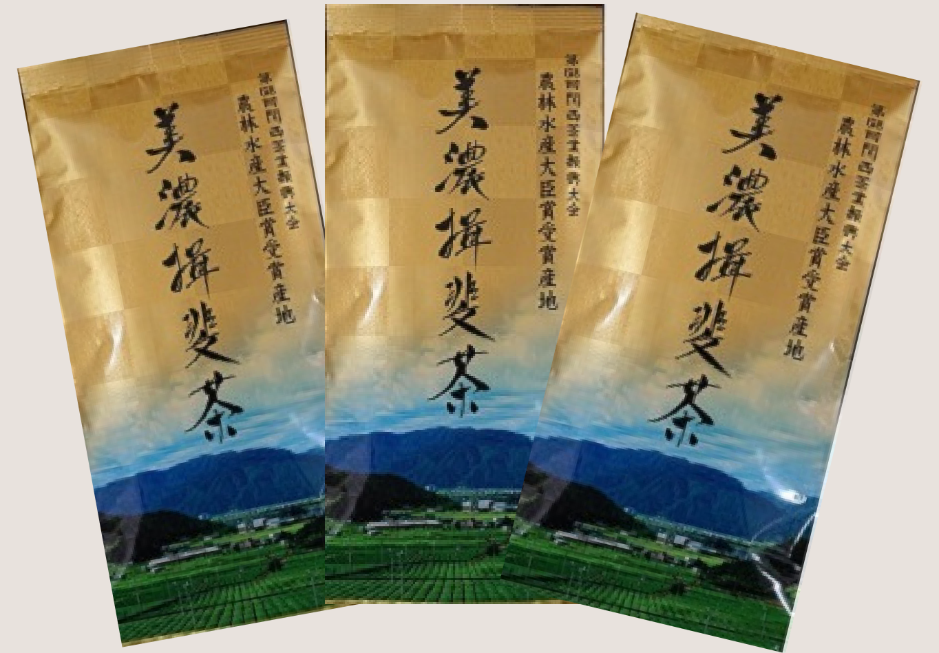
揖斐川町特産品販売幹旋