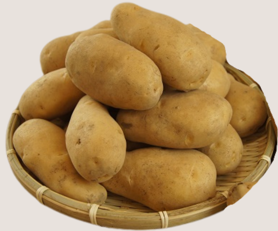
芽室町特産品販売幹旋