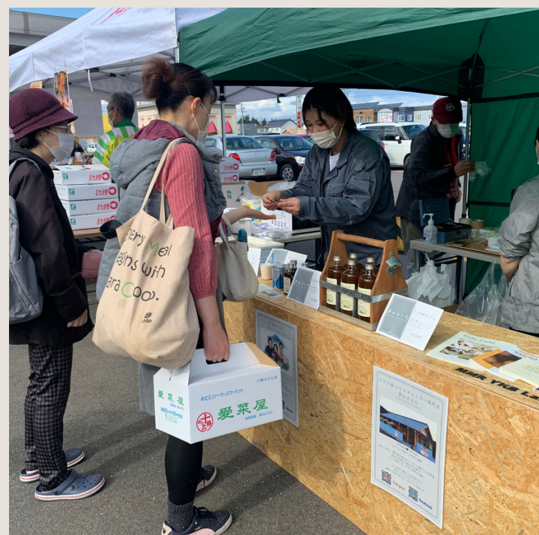
愛菜屋 収穫感謝祭