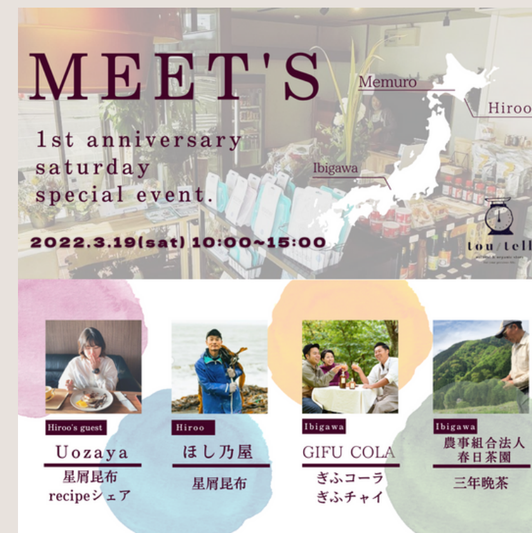
tou/tell 1st anniversary Saturday special event "MEET's"