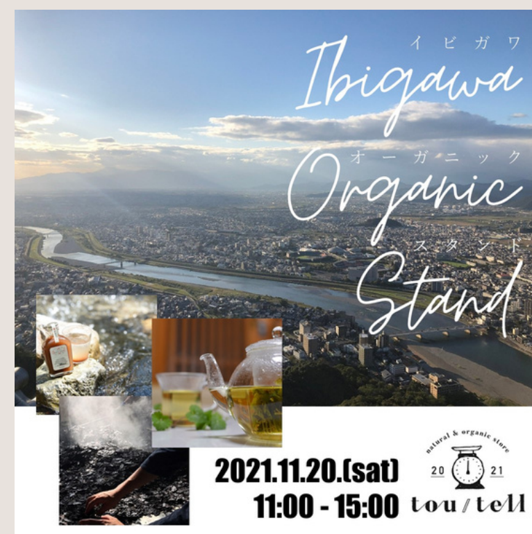
tou/tell Organic Stand