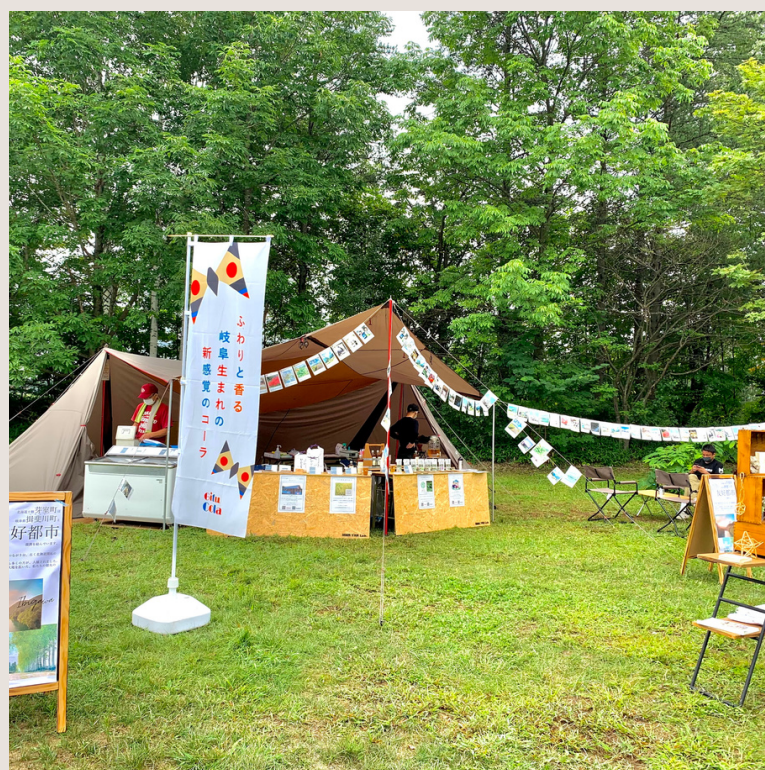
ちいさな森の マルシェ