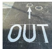
路面に描かれている「IN」「OUT」の表示