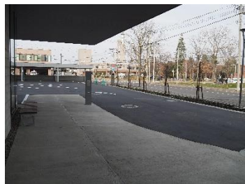
じゃがバス停留所のような庁舎内でお待ちいただくことも可能です